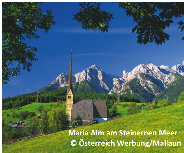
Maria Alm am Steinernen Meer