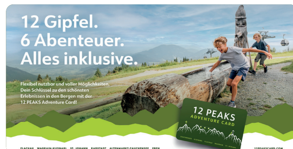
©12 PEAKS Adventure Card